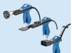
Pistolets de soufflage