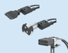
Buses de soufflage d'ions